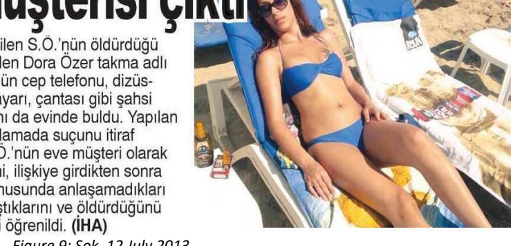
Figure 9: Şok, 12 July 2013

For instance, Sok's article covering the murder of Dora is titled "The murderer of Dora turns out to be a client"; in this way, the fact that the deceased is a sex worker is emphasized and it is implied that murder is an expected end for transgender sex workers. It is also stated, "It is reported that S.Ö. went to the house as a client and he committed murder after having an argument because of the disagreement on the payment"; with this statement, the murder is reduced to a simple bargaining issue and presented to the reader with a mysterious tone through obscure remarks.