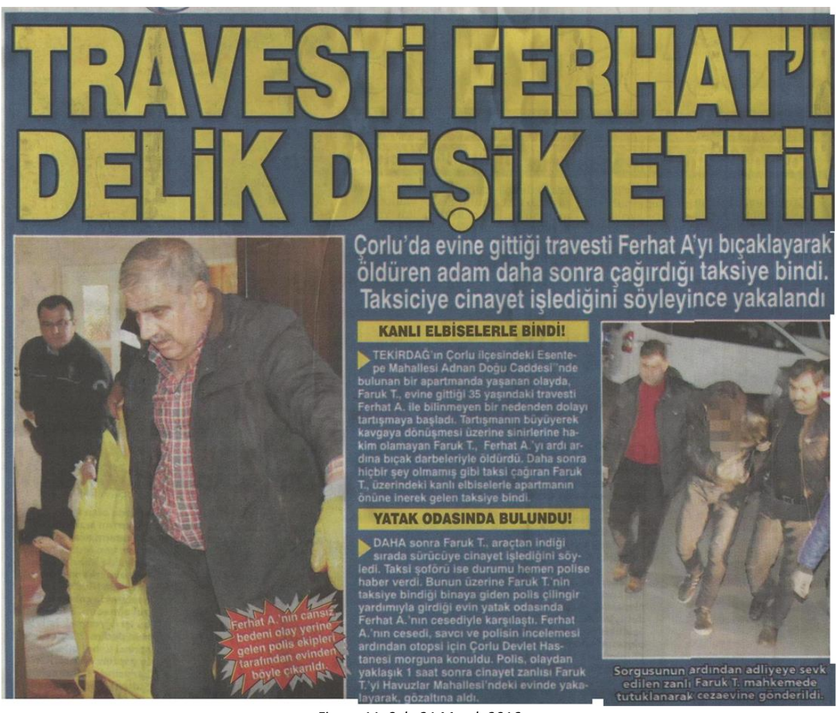
Figure 11: Şok, 21 March 2016

The fact that the murderer was comfortable enough to tell about the murder to the taxi driver must have led the journalist to question the motive of hate in the murder, but the journalists in this example used this detail to structure the story in a way to attract the reader.