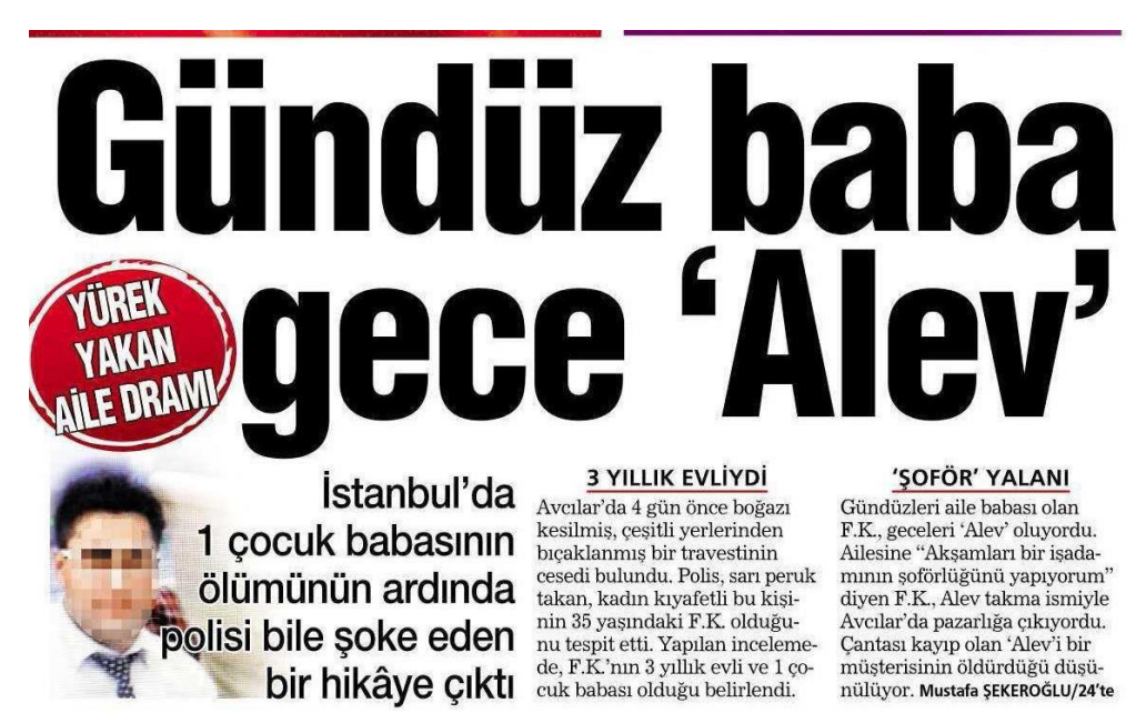
Figure 6: Habertürk, 6 December 2015