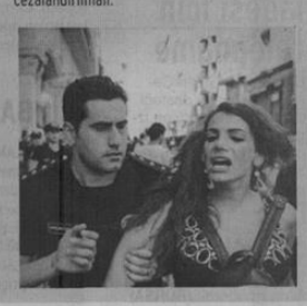
Figure 29: Günlük Evrensel, 20 August 2016

maddesine cinsel yönelim ve cinsiyet kimilği ibareleri eklemmeli. Zorunlu seks işçiliğinin koşullarının ortadan kaldırılması gerekiyor. Bu alanda çalışması istemeyen insanların başka alanda çalışmasını sağlayacak istidma malantırının açılmalı. Seks işçisi kadınların güvenliği için seks işçiliği bir iş kolu olarak karımılamılı ve sendikalaşmanın önündeki bütün engeller kaldırılmalı. Seks işçisi kadınlara, kadınların güvenlikin olarak çalışabileceği özel alanlar gösterilmeli. Bu konuda toplumu bilinçlendirici kamu spotlarının radyo ve televizyon kanallarında dönmesi gerekiyor. Bir bütün olarak sosyal devletin sağlaması gereken eğitim, barınma, sağlık, ulaşım ve yaşım hakları sağlanmalı, bunların önündeki engeller kaldırılmalı. Toplumsal cinsiyet dersi, ilköğretim müfredatında zorunlu hale getirilmeli. Translara ve seks işçilerine dönük ayımcılık ve nefret suçlarıyıl mücadele edilebilmesi için "Ayrımcılıkla Mücadele ve Eşitlik Kanunu'nda nefret suçları ile ilgili mücadele alanları bölümüne "cinsi yönelim" ve "cinsiyet kimilği" ibareleri eklemmeli, Ulusal mevzutat ayrımcılıkla mücadele düzenlemeleri "cinsel yönelim" ve "cinsiyet kimilği" ibareleri kalanları bölümüne "cinsi yönelim" ve "cinsiyet kimilği" ibarelerin kapsayacak şekilde yeniden düzenlemmeli. Siyasi söylemlerde cinsiyetçi ifadeler cezalandırılmalı.