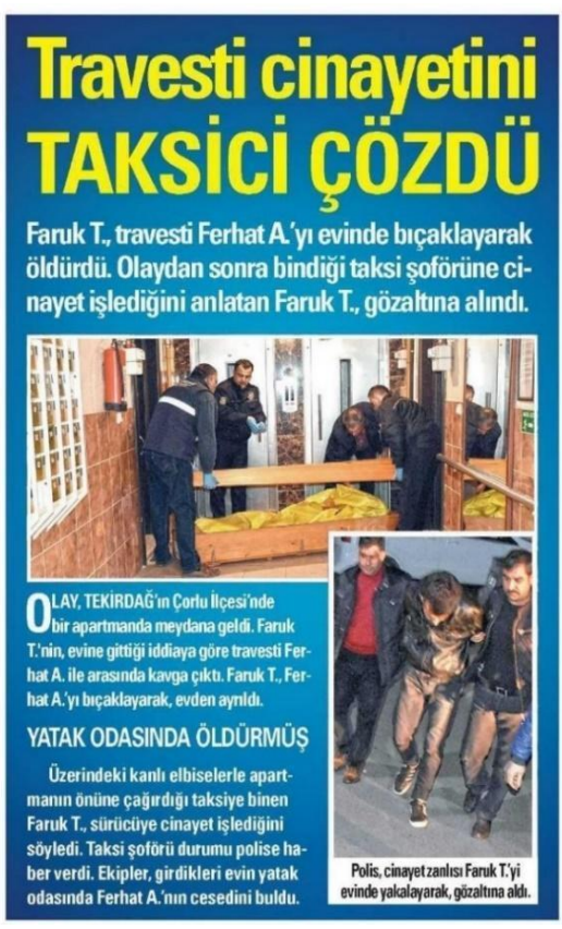
Figure 10: Akşam, 21 March 2016

For instance, Sok's article covering the murder of Dora is titled "The murderer of Dora turns out to be a client"; in this way, the fact that the deceased is a sex worker is emphasized and it is implied that murder is an expected end for transgender sex workers. It is also stated, "It is reported that S.Ö. went to the house as a client and he committed murder after having an argument because of the disagreement on the payment"; with this statement, the murder is reduced to a simple bargaining issue and presented to the reader with a mysterious tone through obscure remarks.