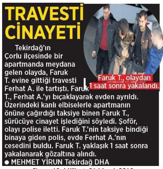
Figure 13: Milliyet, 21 March 2016

Like the structure and frame of the news articles, the words used in the articles also reflect the perspective of heteronormative gender regime. The words and expressions used in the articles direct the reader with certain connotations. For instance, in almost all articles we examined, transgender people are defined with the word 'transvestite' which has negative connotations in social perception.